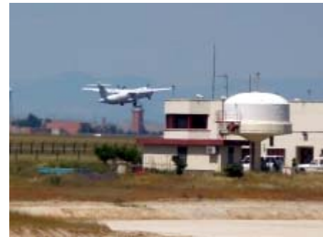
El aeropuerto zaragozano es el tercero de España en tráfico de mercancías

En el mes de septiembre los aviones de mercancía descargaron en Zaragoza 3.729.995 toneladas, un 75,9% más que en la misma fecha de 2008. Esta cifra se vio superada en el mes siguiente, octubre, con un incremento respecto al año anterior del 114% y 4.152.800 tn; en noviembre la cifra descendió hasta las 3.276.082 toneladas pero supuso un nuevo incremento 42%.